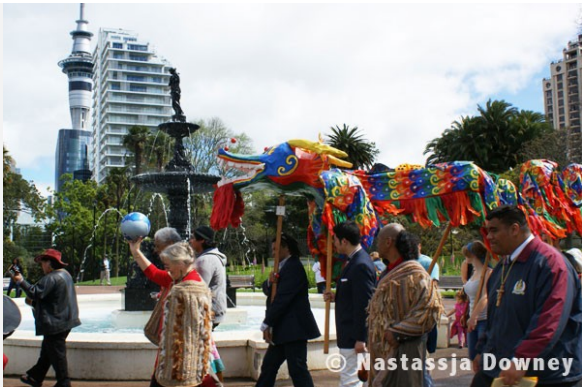
Dragón de la Paz

Los organizadores en Nueva Zelanda han hecho un trabajo excelente organizando actividades en diversas partes de NZ en apoyo a la Marcha y el evento realizado ayer ha sido excelente. La MM fué tomada como una oportunidad para inaugurar una Marcha por la Paz en Auckland. El Guerrero del Arcoiris ( The Rainbow Warrior ) es un fantástico símbolo en Nueva Zelanda y muchos lugares famosos tienen conexión con él. El undimiento de este barco generó un gran cambio en la opinión pública que resultó luego en la resolución de NZ de convertirse en un país no-nuclear, algo que fue muy controversial por aquellos tiempos.