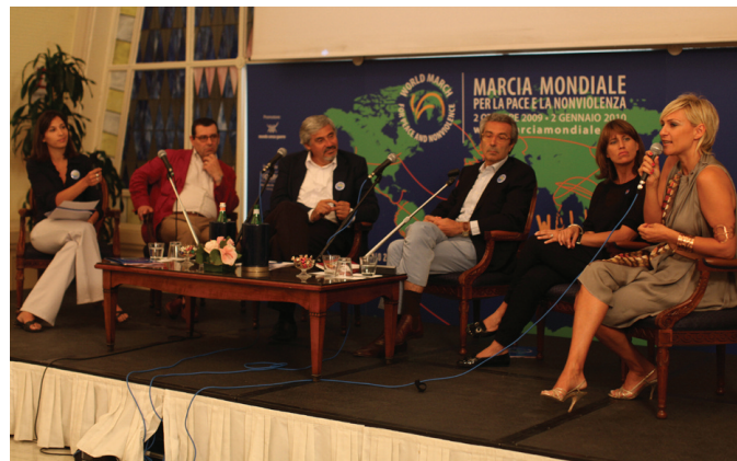
Bob Brown y Elizabeth May