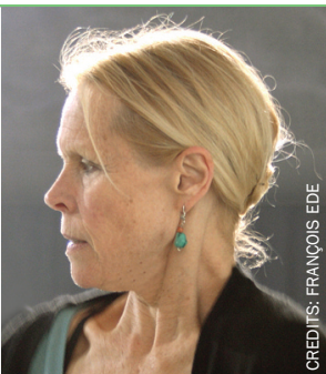
Carolyn Carlson FRANCIA MÚSICA

Isabel Allende es autora de "La casa de los espíritus", "Eva Luna" y "Paula", entre otros muchos títulos. Anteriormente, ejerció como periodista en una revista femenina chilena, en shows de televisión y documentales de cine. Allende ha sido galardonada en su Chile natal, en Estados Unidos y en Italia, pero también ha ganado numerosos premios como escritora y como feminista en todo el mundo.