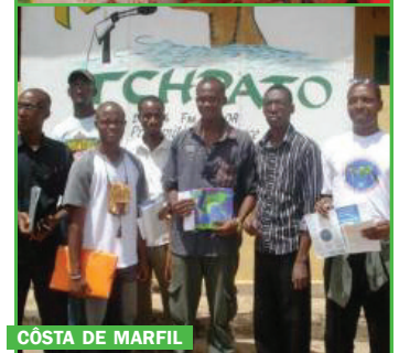
CÔSTA DE MARFIL