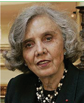
Elena Poniatowska MÉXICO LITERATURA

David Suzuki es un canadiense, divulgador científico en medios de comunicación y activista del medio ambiente. Alcanzó la fama cuando fue el conductor de la popular y antigua serie de televisión "La naturaleza de las cosas", emitida en más de cuarenta países. También es un reconocido crítico de la inacción del gobierno para proteger el medio ambiente y es autor de más de cuarenta libros.