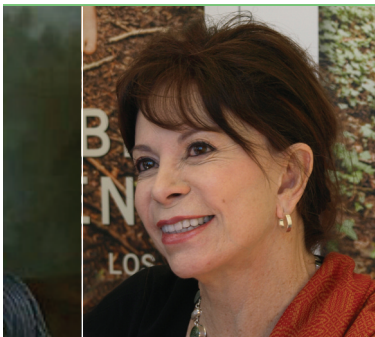
Isabel Allende CHILE LITERATURA

Al finalizar, los participantes trazaron un símbolo humano de la paz en la plaza de la Independencia.