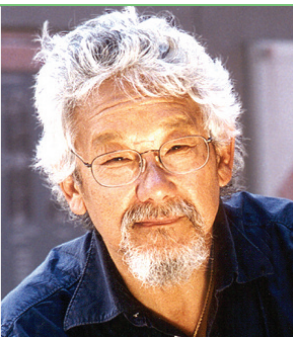
David Suzuki CANADÁ ECOLOGÍA

Chumpitaz es un famoso ex-futbolista peruano. "Invoco a todas las personas, a todos los compañeros del deporte en general, de todas las disciplinas, porque esta Marcha va ser importante, para que veamos que entre los humanos tenemos que tener esta amistad, este cariño, este aprecio. Invoco a todas las personas, del Perú especialmente, para que apoyen esta gran Marcha por la No-violencia".