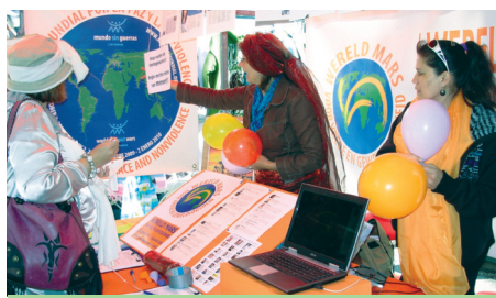
campana de adhesiones en Amsterdam