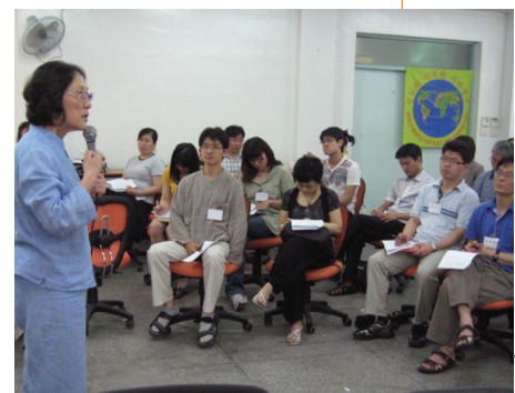
Taller en la Universidad Teológica Metodista de Seúl.

El equipo promotor coreano de la MM, compuesto por más de 30 ONGs pacifistas, proyecta muchas e importantes iniciativas por la paz y la no-violencia.