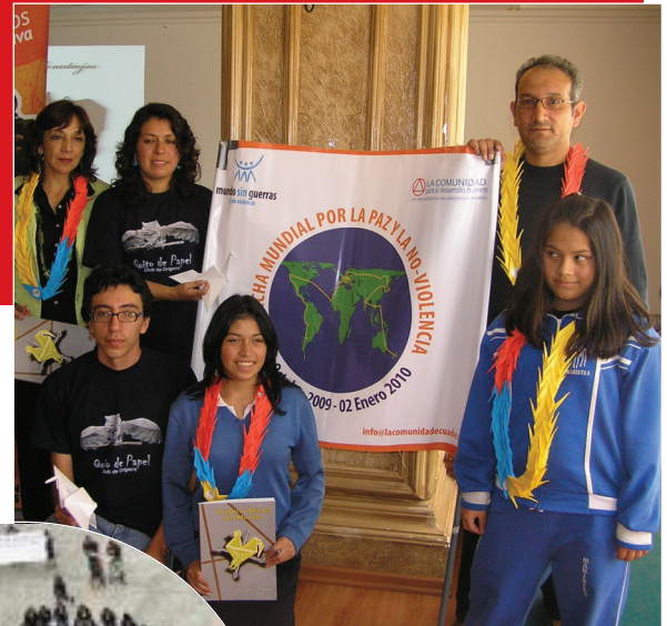
Miembros del Origami club, "Quito de Papel". Símbolo de la Paz en Quito.

Por segundo año consecutivo en Ecuador, cientos de manos se unieron a esta iniciativa, organizada por el "Quito de papel", del Origami club, formado por estudiantes de colegios e institutos de Quito, que pliegan grullas y aprenden sobre el maravilloso mundo