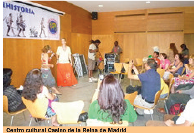
Centro cultural Casino de la Reina de Madrid