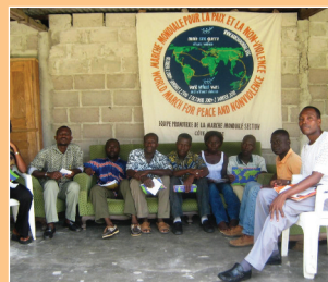
Grupo de promotores de Costa de Marfil.

El dos de octubre comenzará la MM con actos simultáneos en estas cinco ciudades, a los que seguirá otra gira nacional