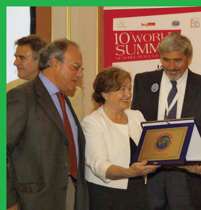
Izquierda: Silo en la Cumbre. Derecha: M. Corrigan junto a los portavoces humanistas R. de la Rubia, T. Hirsch, G. Schultze.