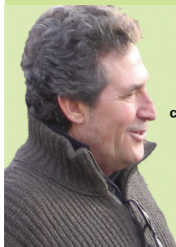
Miguel Ríos y la Marcha Mundial en el concierto

Gran pacifista, el cantante aprovechó para difundir la MM y anunciar su paso por Madrid el próximo 14 de noviembre: "Estoy convencido que, algún día, Charly García no tendrá que cantar nunca más este tema, porque a ningún ser humano le golpearán abajo por ninguna razón; ninguna razón, ni de sexo, ni de religión, ni de cultura, ni de color de la piel, ni de cualquier causa, ni diferencia social, económica. Cualquier ser humano será 'per se' la joya del universo, la cosa más importante del mundo. Para que eso suceda, os animo a uniros a la Marcha por la Paz y la No-violencia, que pasará por Madrid en el mes de noviembre, porque queridos amigos... es un sueño, ¡pero se hará realidad!"