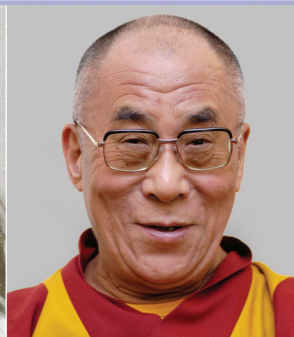
Dalái Lama INDIA PREMIOS NOBEL

La primera actriz española en lograr un Óscar (2009, "Vicky Cristina Barcelona" , dirigida por Woody Allen) ha sido galardonada también con tres premios Goya en España, el premio BAFTA británico y el premio David de Donatello italiano, entre otros muchos premios y nominaciones internacionales. Ha aparecido en casi 50 películas desde su debut en 1991, varias de ellas dirigida por Pedro Almodóvar.