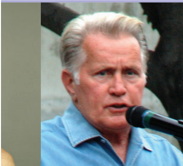
Martin Sheen ESTADOS UNIDOS TV-CINE-TEATRO

Declaró que su gobierno y el pueblo ecuatoriano recibirán al equipobase de la Marcha a su paso por Quito el 18 de diciembre. Y finalizó con un llamamiento a la adhesión de todos los líderes políticos, sociales, culturales y religiosos del mundo, a través de un poema de Rafael Alberti .