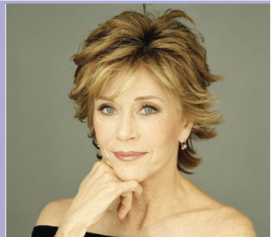
Jane Fonda ESTADOS UNIDOS TV-CINE-TEATRO