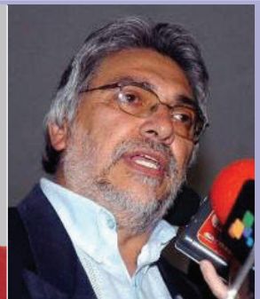
Fernando Lugo PARAGUAY POLITICA

Su Santidad el XIV Dalai Lama, Tenzin Gyatso , es un líder espiritual del Tíbet. Vive en el exilio en Dharamsala, al norte de la India. En 1989, fue galardonado con el premio Nobel de la Paz, que le dio mayor notoriedad mundial. Ha sido motivo de varias películas de Hollywood ( Siete años en el Tíbet y Kundun ) y de numerosos documentales y programas de televisión.