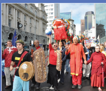
el equipo-base con el pueblo moriori y marchando en Auckland