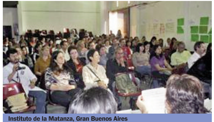
Instituto de la Matanza, Gran Buenos Aires

Más tarde, se formaron grupos de trabajo entre los presentes, que prepararon propuestas de actividades en las escuelas para la promoción de los temas de la Marcha entre los alumnos. Como material de apoyo se utilizó el manual "Nos ponemos en marcha".