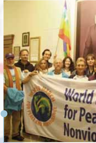
RUSSIE L'équipe de base visite la Fondation Gorbatchev à Moscou, en Russie, le 22 octobre.