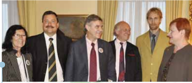
FINLANDE La Présidente de Finlande, Tarja Halonen, premier mandataire politique à recevoir la Marche Mondiale. Lors de l'acte du 28 octobre, elle a publiquement formalisé son soutien.

Plus d'informations sur le sommet de Berlin : www.nobelforpeace-summits.org .