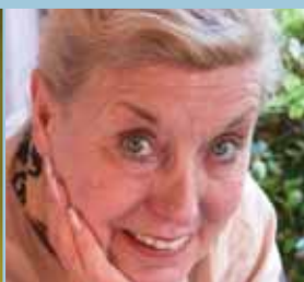
Quelques prix Nobel pour la paix qui seront au sommet. De gauche à droite : F.W. de Klerk, Betty Williams, Mikhail Gorbachev, Lech Walesa, Muhammad Yanus, Mairead Maguire