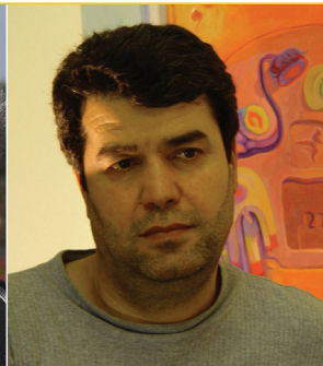
Adnan Shino IRAQ ARTE

Es el director de cine, guionista y productor español que mayor resonancia ha logrado fuera de su país. Ha recibido los principales galardones cinematográficos internacionales, que incluyen dos premios Óscar, en diversas categorías. Ostenta la Orden de Caballero de la Legión de Honor francesa (1997) y ha obtenido la Medalla de Oro al Mérito en las Bellas Artes (1998)