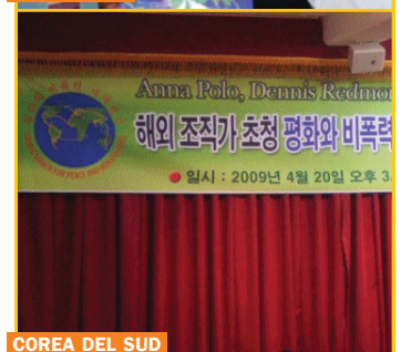
COREA DEL SUR