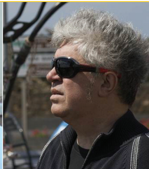
Pedro Almodóvar ESPAÑA CINEMA

Es el representante musulmán más importante de Guinea. "Este movimiento de paz necesita de todo el apoyo posible, por lo tanto, me comprometo y me sumo a esta MM. Cualquier desarrollo duradero, cualquier progreso cultural, tiene como condición necesaria la adquisición de la paz. Nos consideramos un poco pioneros en términos de paz en África. Creemos que la paz debe ser aplicada en cada aspecto de vida".