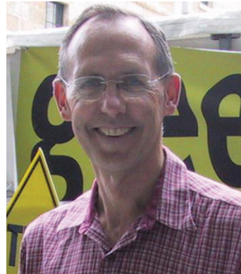
Bob Brown y Elizabeth May