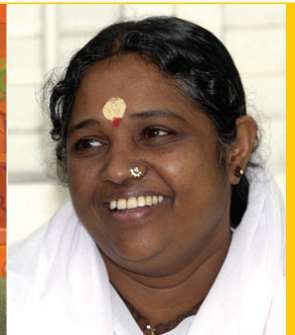
Amma INDIA RELIGIOUS & SPIRITUAL

Fundador de la Academia iraquí de arte. Artista iraquí muy comprometido con el tema de la no-violencia. "Si una persona no puede amar, terminará odiando. Es una cuestión de responsabilidad humana no cerrar los ojos frente a la pobreza, a la guerra, la explotación y a la injusticia".