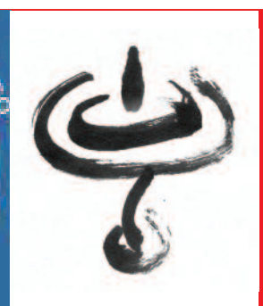
Unitarian Universalists HONG KONG RELIGIÓN Y ESPIRIT.

Organismo para la proscripción de armas nucleares en América Latina y el Caribe. Es un organismo intergubernamental, creado por el Tratado de Tlatelolco, para asegurar su cumplimiento: responsable de convocar conferencias y reuniones sobre los propósitos, medidas y procedimientos establecidos en el Tratado, y para supervisar la realización del sistema de control y de las obligaciones derivadas de Tlatelolco.