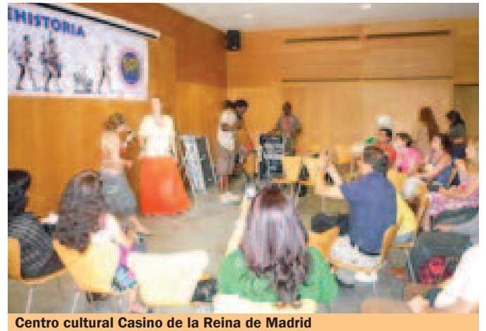
Centro cultural Casino de la Reina de Madrid