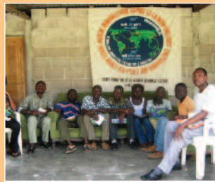
Grupo de promotores de Costa de Marfil.

El dos de octubre comenzará la MM con actos simultáneos en estas cinco ciudades, a los que seguirá otra gira nacional