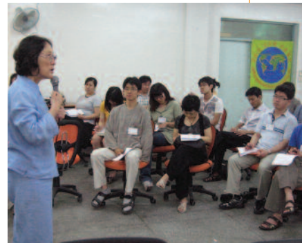
Taller en la Universidad Teológica Metodista de Seúl.

El equipo promotor coreano de la MM, compuesto por más de 30 ONGs pacifistas, proyecta muchas e importantes iniciativas por la paz y la no-violencia.