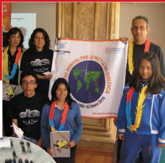
Miembros del Origami club, "Quito de Papel". Símbolo de la Paz en Quito.

Por segundo año consecutivo en Ecuador, cientos de manos se unieron a esta iniciativa, organizada por el "Quito de papel", del Origami club, formado por estudiantes de colegios e institutos de Quito, que pliegan grullas y aprenden sobre el maravilloso mundo