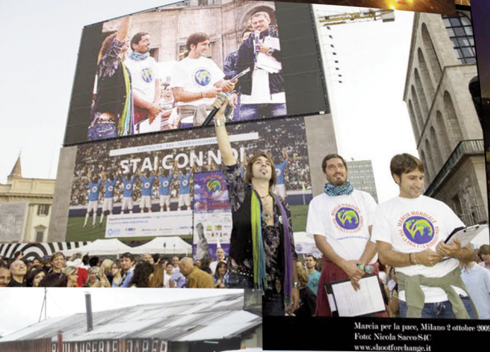
Marcha per la pace, Milano 2 ottobre 2009