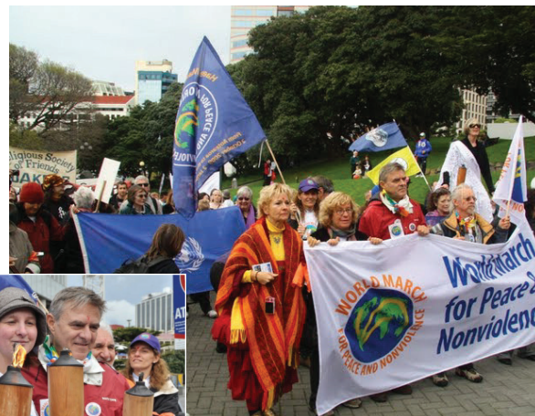
Actos del inicio de la Marcha en Wellington

Durante los tres meses, los miembros del equipo-base se identificarán por un brazalete y llevarán, además de sus banderolas, la antorcha encendida que llegará hasta la Conferencia de no-proliferación nu-