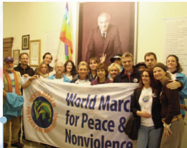
RUSSIA El equipo-base visita la Fundación Gorbachov en Moscú, Rusia, el 22 de octubre.