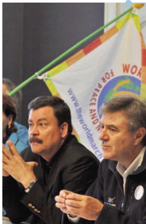
FINLANDIA La presidente de Finlandia, Tarja Halonen, se convierte en la primera mandataria política que recibe a la Marcha Mundial por la Paz y la No-Violencia. Durante el acto en el Helsinki del 28 de octubre expresó su apoyo públicamente.