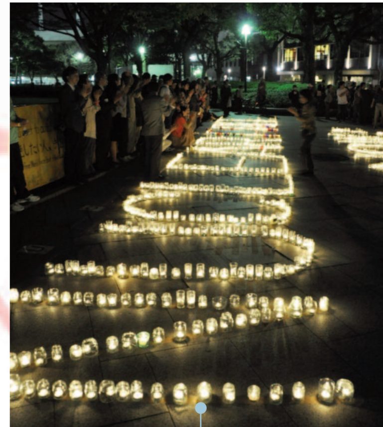
JAPÓN 1000 velas escriben el lema 'No nukes 2020' (no más armas nucleares) en Hiroshima, acto organizado por la Fundación de la paz y de la cultura, con motivo de la llegada de la MM el 17 de octubre.